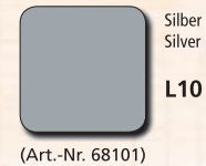
Silber Silver L10