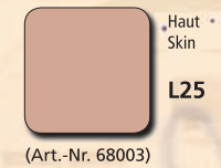
Haut Skin L25