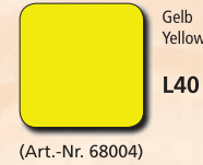
Gelb Yellow L40