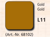
Gold Gold L11