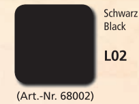
Schwarz Black L02