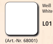
Weiß White L01

pro-color BODYPAINTS are distinguished by high luminosity, flexible application and a high degree of skin compatibility. The special composition of the paint ensures that skin does not feel taut or tense. Natural breathing of the skin is assured, and the paint can be easily rinsed off again with water, making it ideal for decorative coloured bodypainting and creative makeup for children.