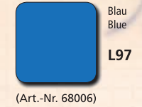
Blau Blue L97