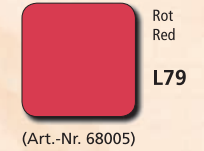
Rot Red L79